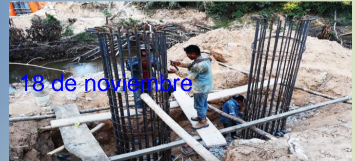
18 de noviembre