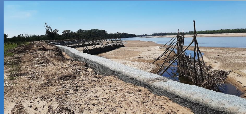
Salchichones y Pirámides