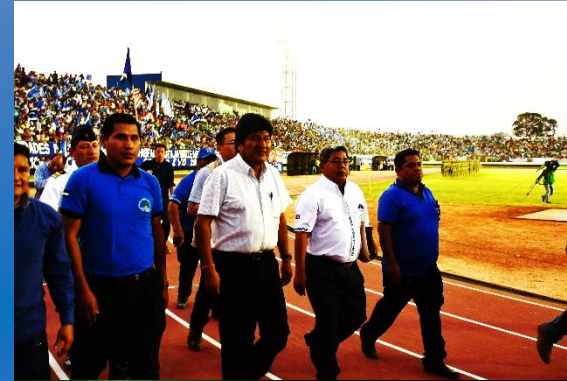
Estadio Integración Bolivia