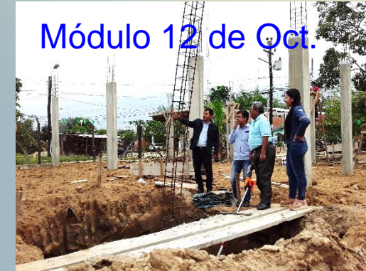
Módulo 12 de Oct.