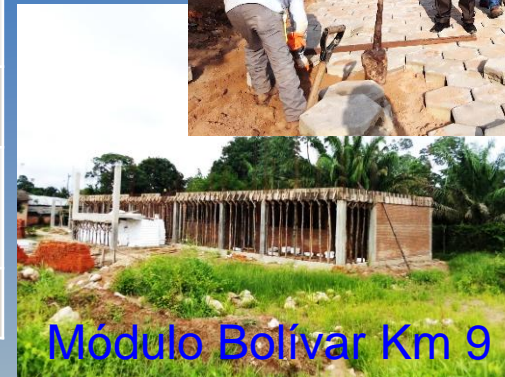
Módulo Bolívar Km 9