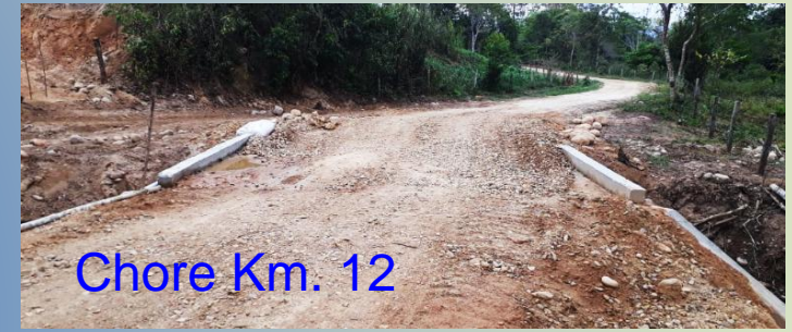
Chore Km. 12