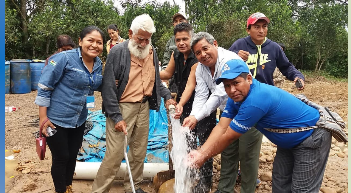
Sind. San José