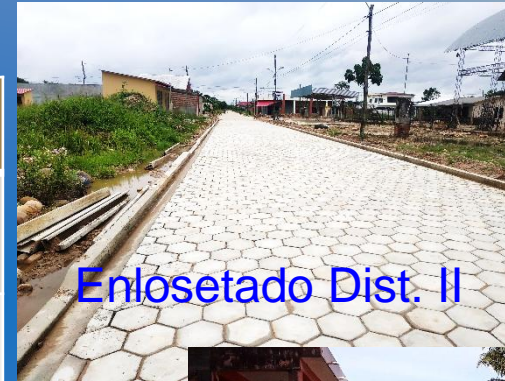
Enlosetado Dist. II